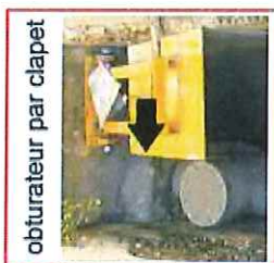
obturateur par clapet